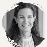
Ann-Marie Ovin Advokatfirman Vinge

Vi har haft ett nära och bra samarbete under många år och det finns ett etablerat förtroende för er kompetens. Hos Xenit finns ett äkta engagemang i kombination med professionalism och värme. Ni bryr er på riktigt och har en respekt för våra utmaningar och vår komplexitet. Ni är också snabba på bollen, ligger i framkant och är lösningsorienterade. Utan en så snabbfotad samarbetspartner hade vi inte kunnat genomföra vårt pilotprojekt av Microsoft 365 Copilot